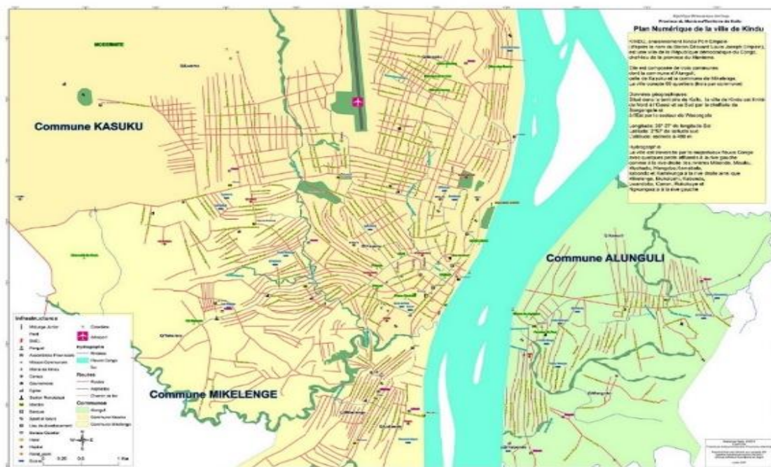
Figure 1 : Localisation géographique de la ville de Kindu dans la province du Maniema, République Démocratique du Congo.

La ville de Kindu est située au centre-est de la République Démocratique du Congo et constitue le chef-lieu de la province du Maniema. Elle est localisée entre les latitudes 2°57' et 3°08' Sud et les longitudes 25°55' et 26°30' Est. Administrativement, la ville comprend les communes de Kasuku, Mikelenge et Alunguli. Cette position géographique lui confère un rôle stratégique dans les échanges économiques régionaux, tout en posant d'importants défis liés à la gestion de l'environnement urbain et des déchets solides ménagers. Le climat de type tropical humide favorise la décomposition rapide des matières organiques et la stagnation des eaux en cas d'obstruction des caniveaux par les ordures. La localisation géographique de la zone d'étude est présentée dans la Figure 1.